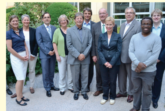
Rat für Entwicklungszusammenarbeit (REZ) der Landesregierung Baden-Württemberg. Dieser vertritt die Zivilgesellschaft und führt jährlich die Entwicklungspolitische Landeskonferenz durch.